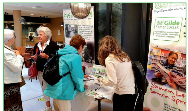
Presentatie Cursus- Infomarkt 16 september in Roermond