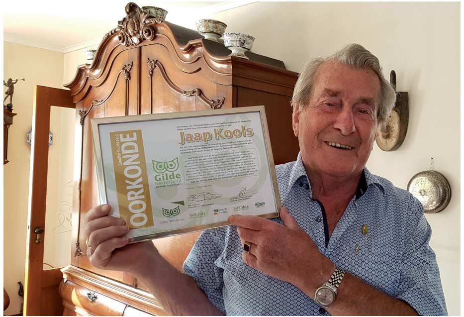
De trotse 90-jarige met Gouden Gildespeld én Oorkonde

Toen er een bestuursvacature kwam gaf hij zich op en niet veel later werd hij penningmeester. Hij heeft de penningen 15 jaar lang beheerd. Toen een nieuwe man zich aanmeldde om deze taak van hem over te nemen trad hij terug en werd "gewoon" bestuurslid. Hij bezoekt mensen die zich aanmel-