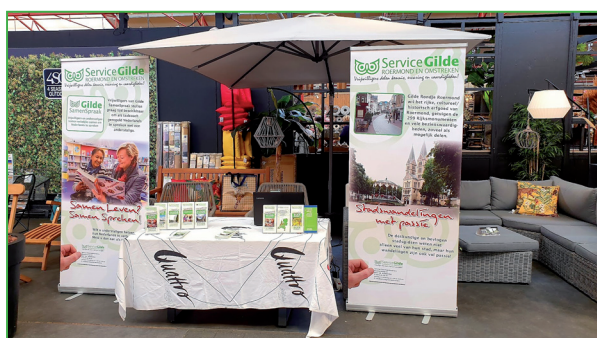
Presentatie 'Senioren in het Groen' bij tuincentrum, 11 augustus in Roermond