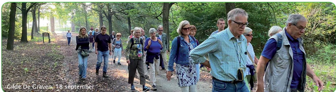
Gilde De Graven, 18 september

POWER ook in Breda! VEERKRACHT OP LEEFTIJD