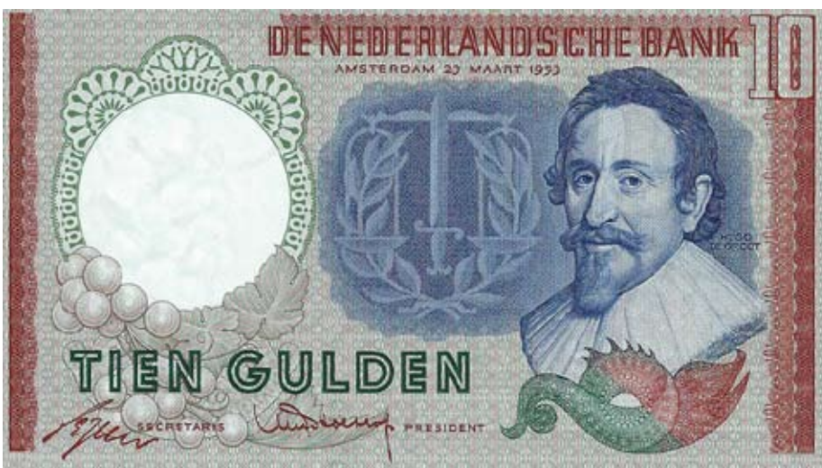
Nederland Tien Gulden 1953 - 'Hugo de Groot'