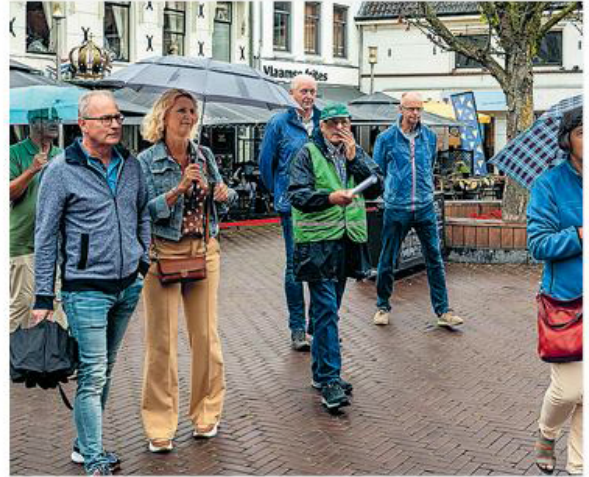
■ De wandelingen worden volgens de richtlijnen gehouden.

De deelnemers ontvangen een boekje met een duidelijke beschrijving van de route en