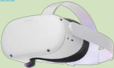
VR viewer: Oculus Quest 2

Kijk eens op: https://arvr.google.com/earth/