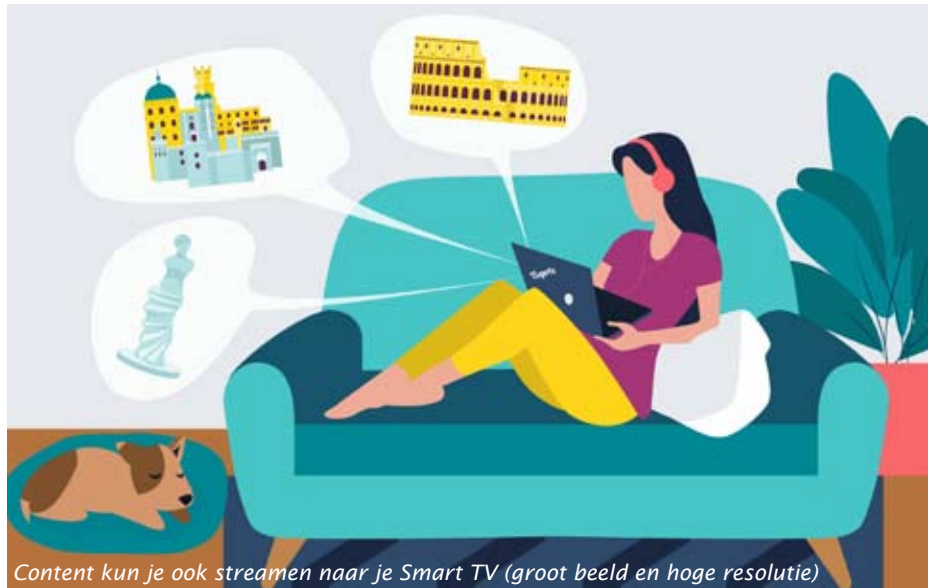
Content kun je ook streamen naar je Smart TV (groot beeld en hoge resolutie)