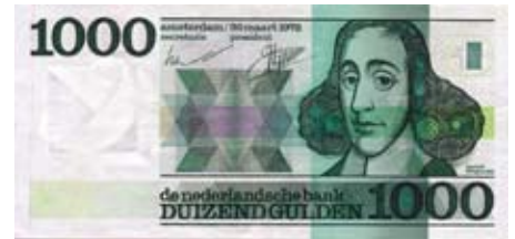
Een afbeelding van Baruch Spinoza staat op het 1000 gulden biljet

Ook de veertig gidsen in Den Haag staan te popelen om weer van start te kunnen met de 25 stadswandelingen. Enkele gidsen buigen zich momenteel over een nieuwe wandeling: 'In de voetsporen van Spinoza'. Tijdens deze rondleiding maken de wandelaars kennis met Spinoza's leven, zijn filosofie, zijn geestverwanten en zijn volgelingen. De gemeente Den Haag heeft deze wereldberoemde Nederlandse filosoof benoemd tot icoon van de stad van Vrede en Recht en oktober 2021 uitgeroepen tot Spinozamaand. Op de website van Gilde Den Haag, www.gildedenhaag.nl staat binnen-