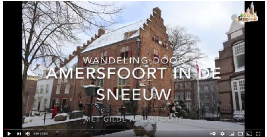
Gilde Amersfoort was zo slim om 'Een wandeling door Amersfoort in de sneeuw' (3 minuten) te maken: https://www.youtube.com/watch?v=llMwzqYQzC8&t=1.19s

Als begeleiding van de beelden kan je kiezen voor de straatgeluiden, geen begeleiding door geluid of tekst, gesproken tekst of informatie geven met tekstblokken en muziek, maar denk